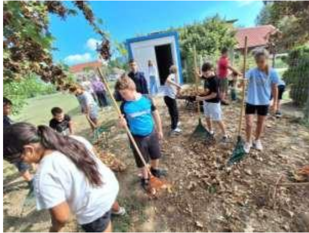
1. Kép: Az őszi falevelek takarítása