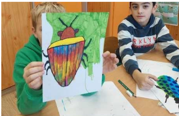
8. Kép: A poloska rajzok