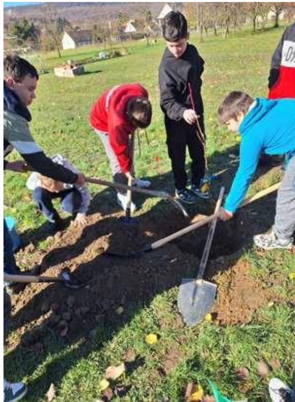
2. Kép: A gyümölcsfák ültetése