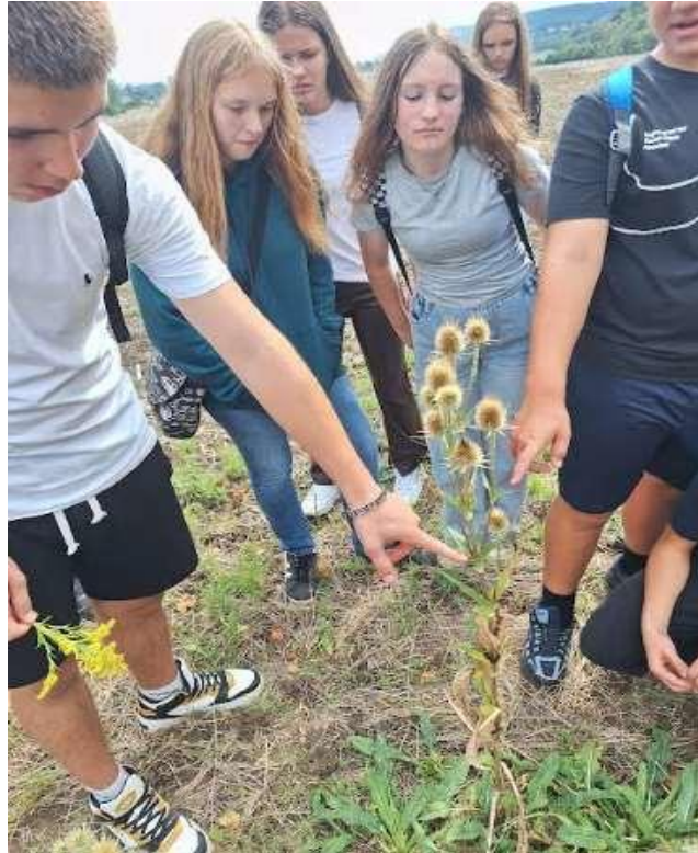
11. Kép: A tanulók szemügyre veszik a mácsonyát, amelynek tányérszerű levélnyelénél megáll az esővíz