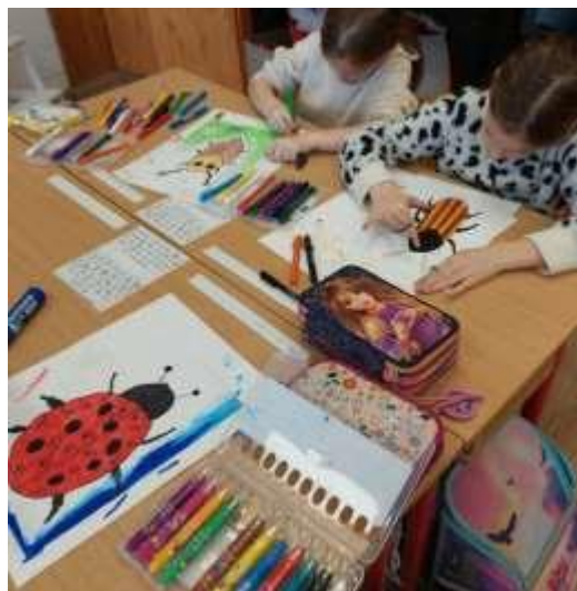
7. Kép: A rajzos növény és állathatózó elkészítésének kezdeté