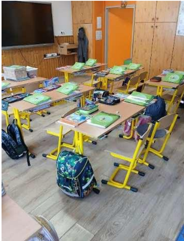
13. Kép: A kiosztott füzetek csendélete