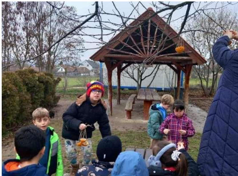
22. Kép: Az etetők kihelyezése