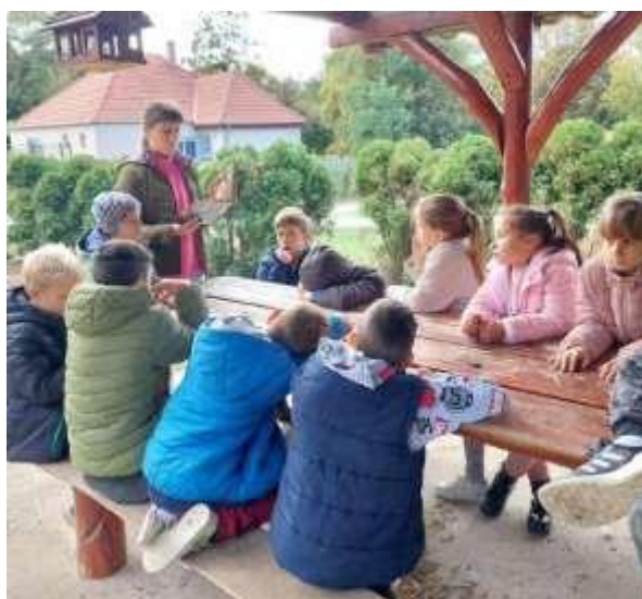
18. Kép: Őszi mesék foglalkozás az óra keretein belül