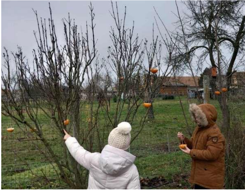
23. Kép: A gondos helyszívválasztás