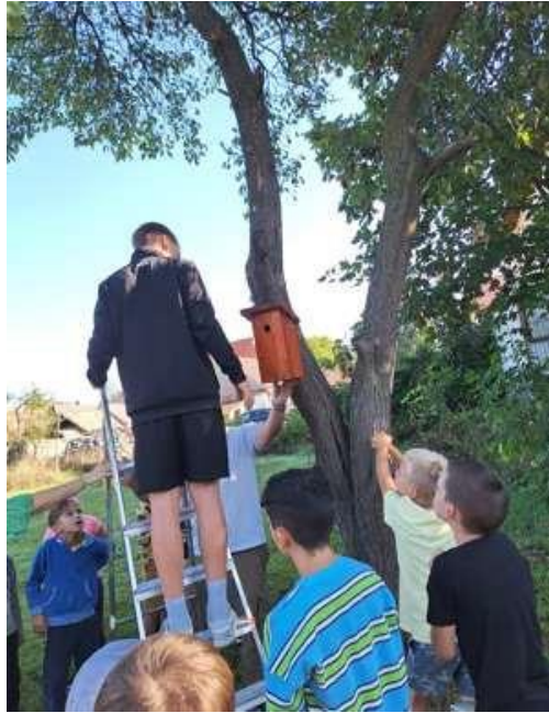
5. Kép: A madárodúk kihelyezése