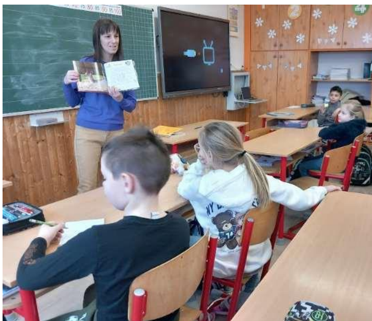
20. Kép : "Téli mesék" foglalkozás