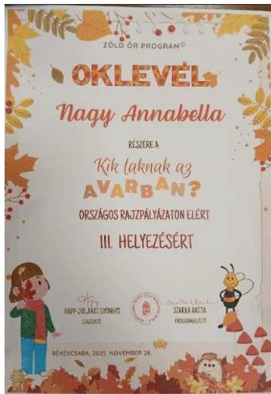
16. Kép: "Ki lakik az avarban?" - rajzpályázat III. helyezés