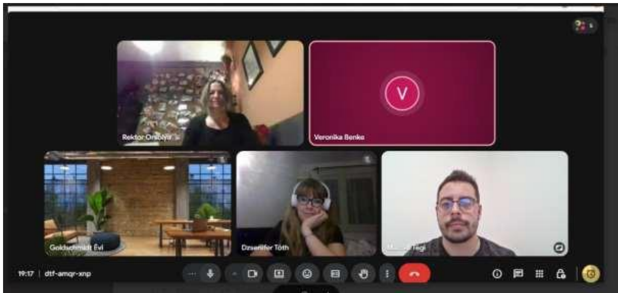
26. Kép: Munkamegbeszélés az aktuális feladatokról

A második félév során a környezeti nevelés és a fenntarthatóságra nevelés kiemelt szerepet kapott. A tanév folyamán több gyakorlati és terepi foglalkozás valósult meg, amelyek célja a természetközeli tapasztalatszerzés és az iskolakerti tevékenységek erősítése volt. A fejlesztések és programok során szakmai képzésen is részt vettünk az Agostyáni Ökofalu-ban, amely hosszú távú együttműködés megalapozását szolgálta.