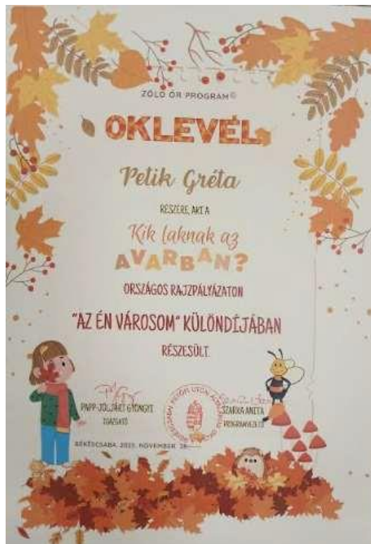
15. Kép: "Ki lakik az avarban?" rajzpályázat különdíj