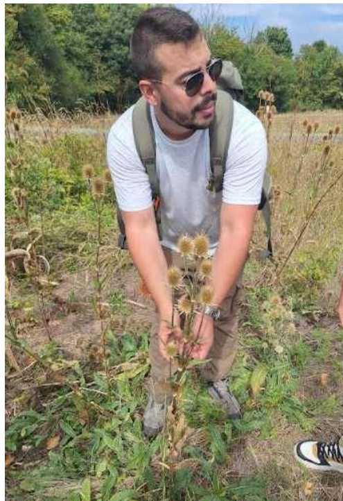
10. Kép:A mácsonya mint természetes madáritató