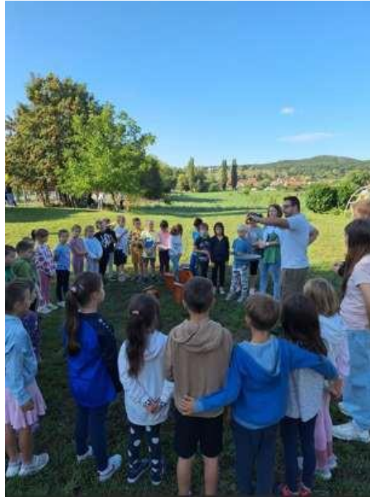
3. Kép: Mit tudunk a madarak életéről? Ráhangolódás