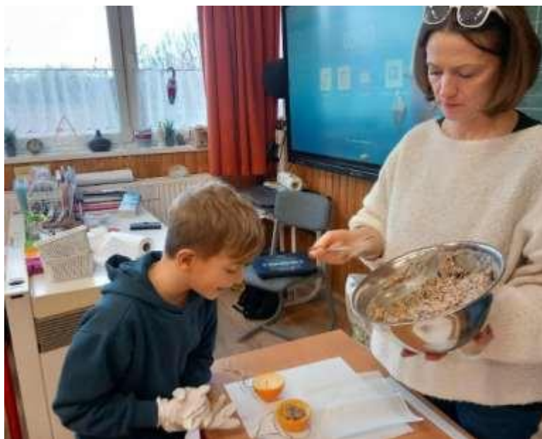
19. Kép: narancsetető készítésének technikájának ismertetése