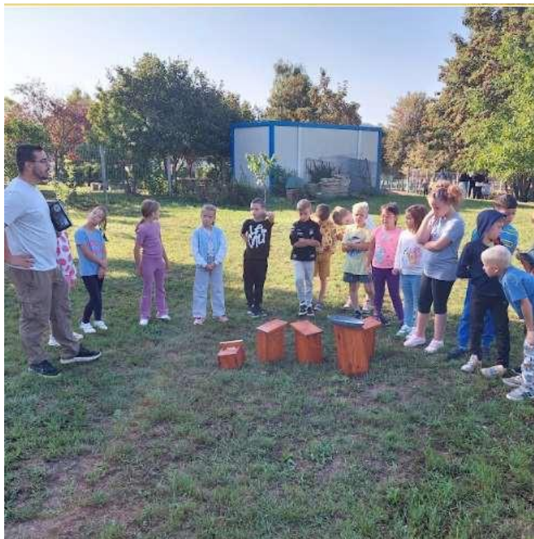
4. Kép: Ismerkedés a madárodúkkal