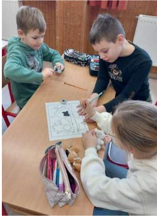
21. Kép: Játékos feladatok