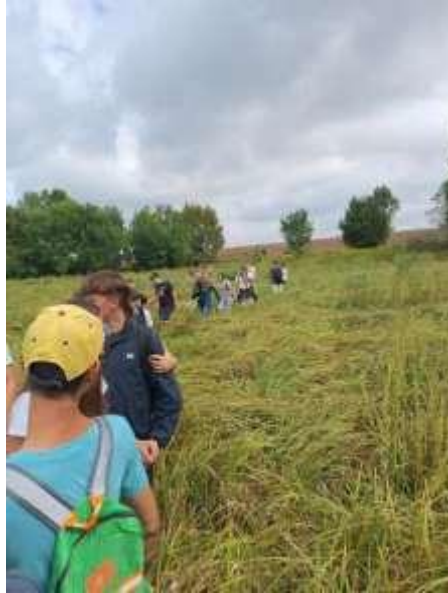
9. Kép: A 8. évfolyamosok a terepgyakorlat során