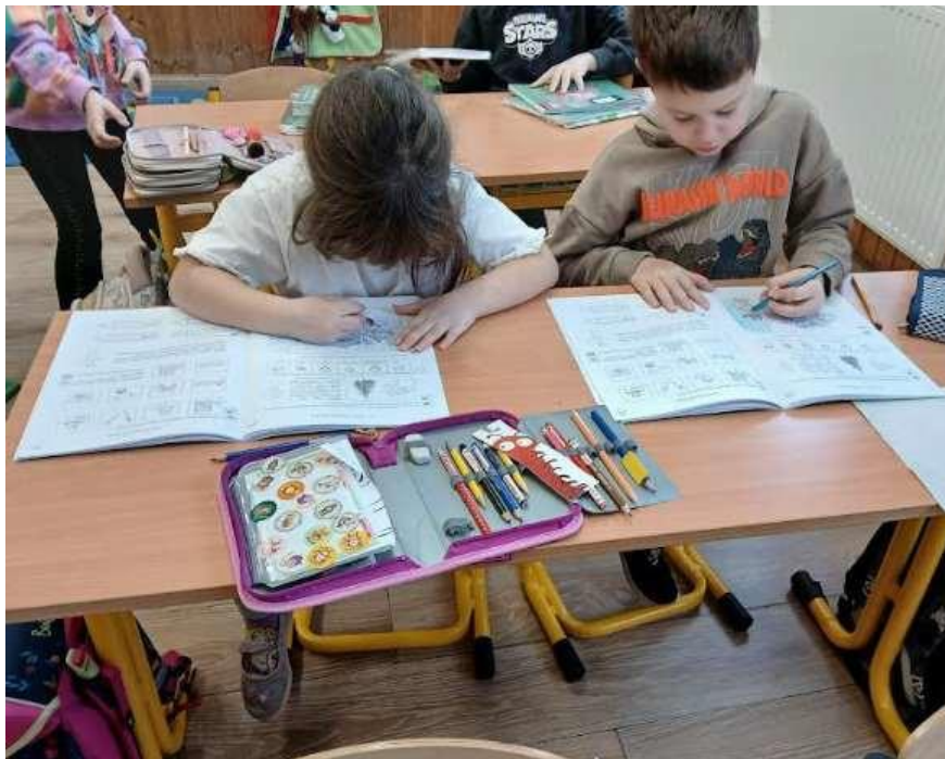
14. Kép: Tanulók munka közben