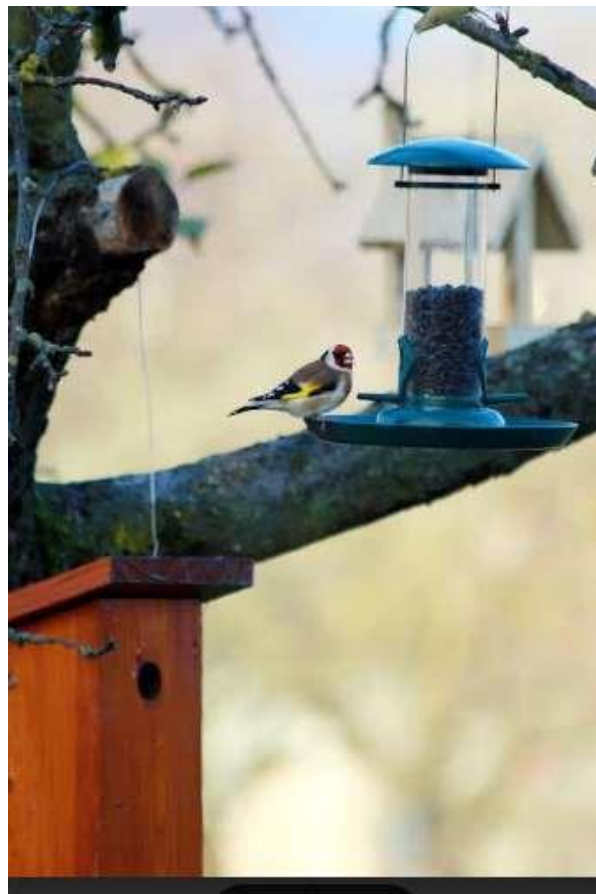
25. Kép: Tengelic az etetőn a téli etetés során, alatta egy cinke odú