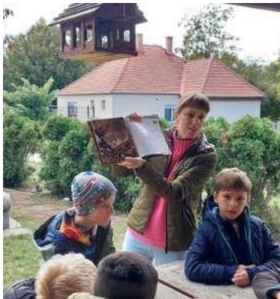
17. Kép: "Rendhagyó" könyvtári óra a szabadban